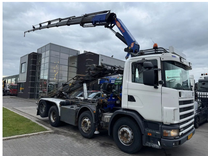
Scania R114-380 8X2 - EURO 3 + PM 23525SP LC 2013! + ...