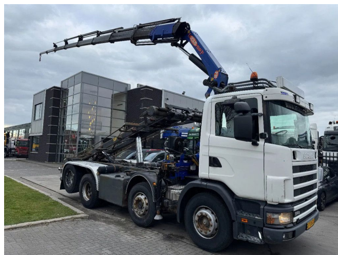
Scania R114-380 8X2 - EURO 3 + PM 23525SP LC 2013! + ...