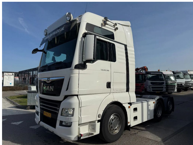
MAN TGX 26.500 6X2 - EURO 6 + LIFTING AXLE