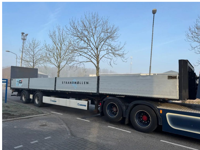
Krone SZ - 2 AXLE BPW + STEERING + ZEPRO Z 2500-150...