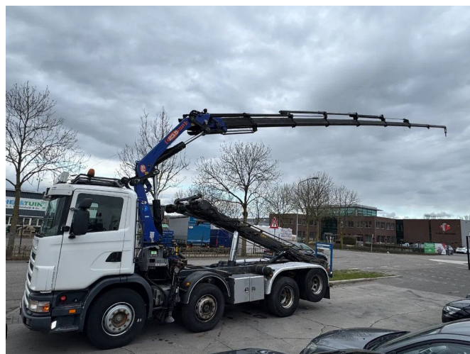
Scania R114-380 8X2 - EURO 3 + PM 23525SP LC 2013! + ...