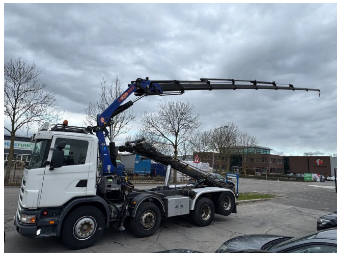
Scania R114-380 8X2 - EURO 3 + PM 23525SP LC 2013! + ...