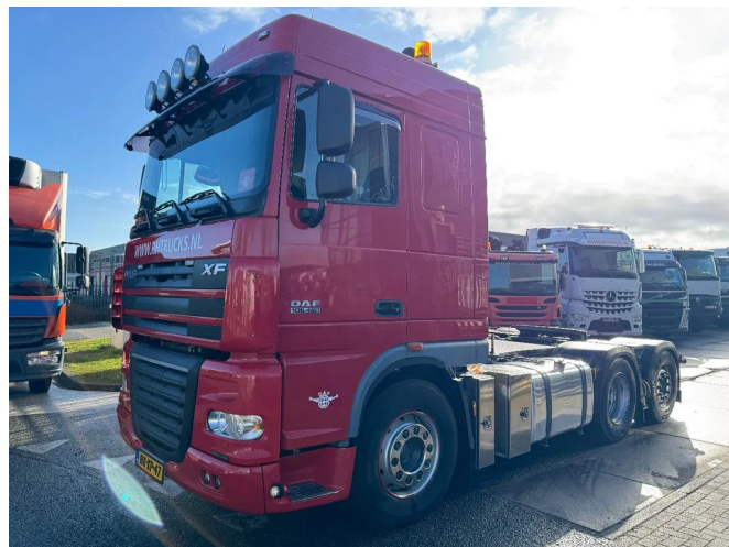
DAF XF 105.460 6X2 - EURO 5 + LIFT/STEERING AXLE