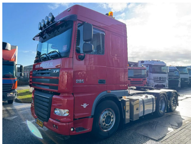
DAF XF 105.460 6X2 - EURO 5 + LIFT/STEERING AXLE

• ABS • Achteruitrijcamera • Airconditioning • Aluminium brandstoftank • Antiblokkeersysteem • Centrale deurvergrendeling • Centrale deurvergrendeling afstandbediend • Centrale smering • Cruise control •