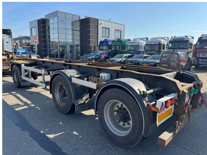
Floor FLA-10-20 - 3 AXLE BPW