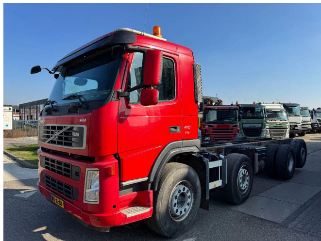
Volvo FM 410 8X2 - EURO 5 + LIFT/STEERING AXLE