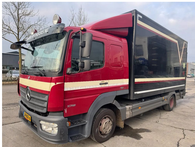
Mercedes-Benz Atego 1016 4X2 - EURO 6 + DHOLLANDIA LIFT