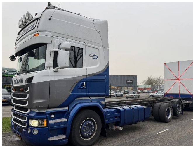
Scania R580 6X2 - EURO 6 + DHOLLANDIA LIFT + LIFT/ST...