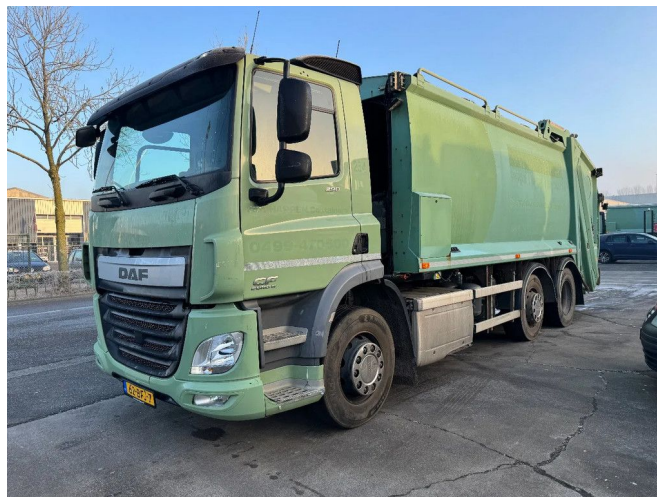
DAF CF 290 6X2 EURO 6 DENNIS EAGLE OLYMPUS 21W