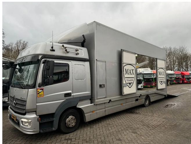
Mercedes-Benz Atego 1224 4X2 MOETEFINDT EURO 6 RE...