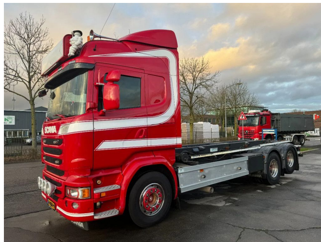
Scania R450 6X2 VDL 18T CABLE RETARDER EURO 6 TÜV...