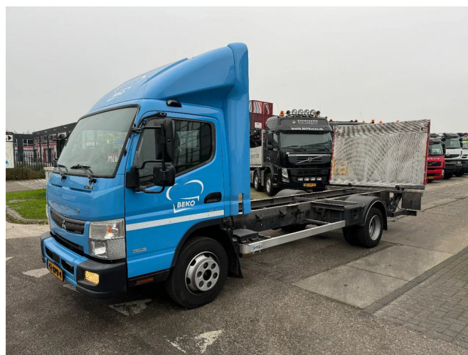
FUSO Canter 9C18 EURO 6 DHOLLANDIA LOAD LIFT 4x2