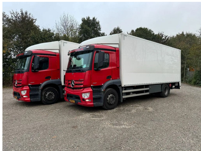
Mercedes-Benz Antos 1927 4X2 4 UNITS TÜV TILL 08-2025...