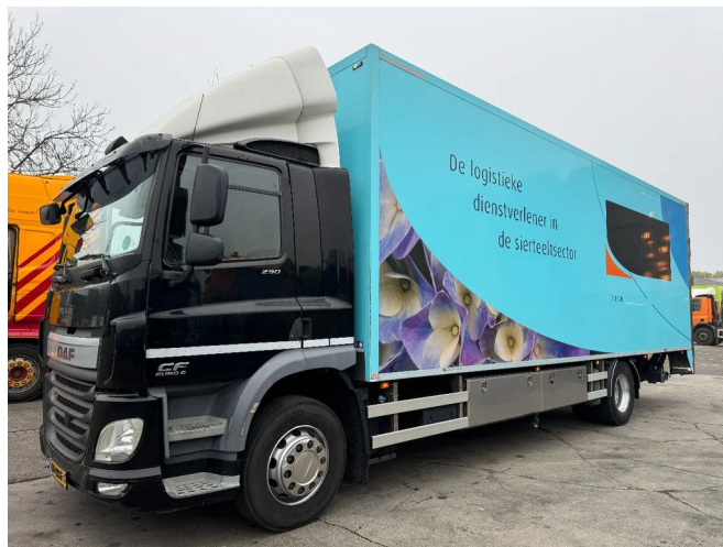
DAF CF 290 4X2 - EURO 6 + HEATING SYSTEM + BÄR CA...