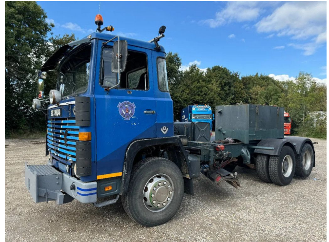
Scania LB141 V8 6X2 HUB REDUCTION - FULL STEEL SU...