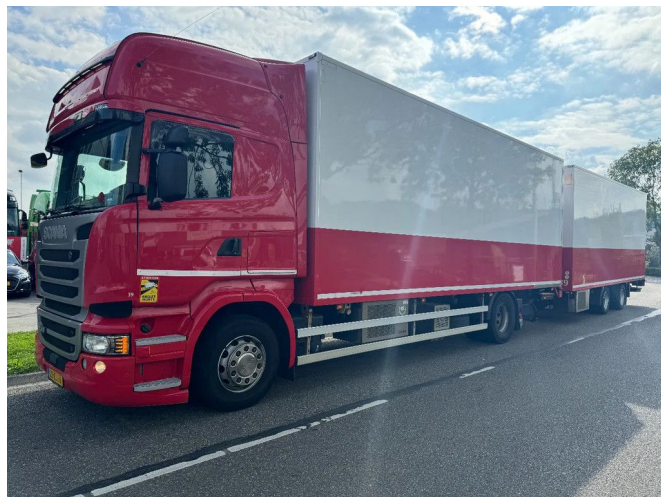
Scania R410 4X2 + CARRIER TRS + BURG HANGER + 2X ...