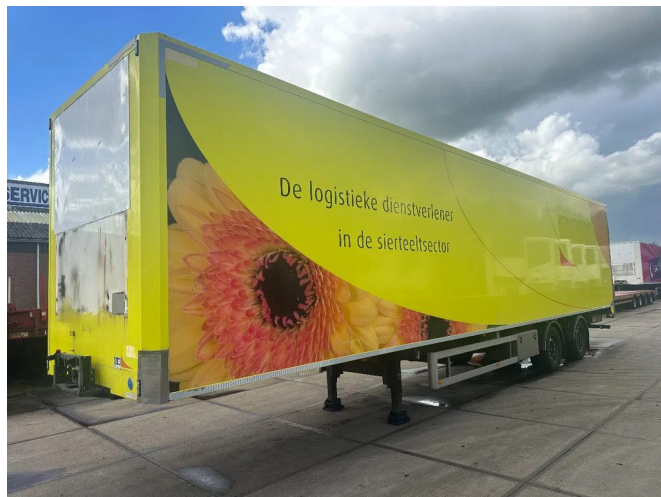
H.T.F. 1e AS LIFT 2e STUUR 13,5 X 2,5 X 2,74M