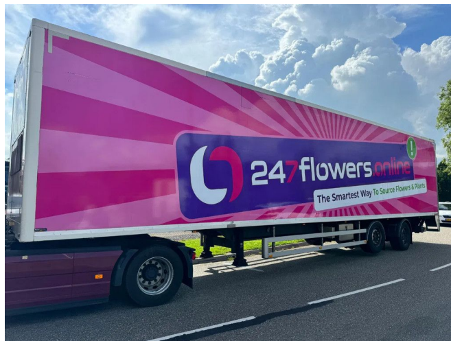
H.T.F. 1e AS LIFT 2e STUUR 13,5 X 2,5 X 2,74M