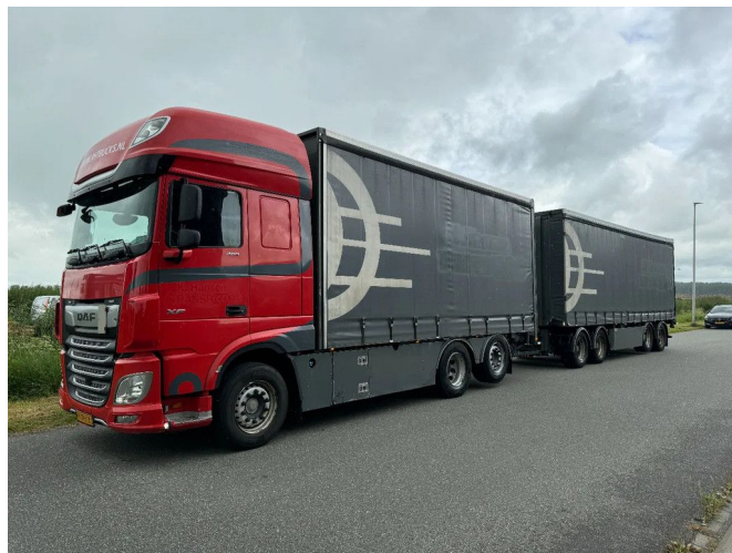
DAF XF 480 6X2 EURO 6 + M&V HANGER