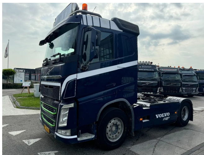
Volvo FH 460 4X2 EURO 6 - KIPPER HYDRAULICS