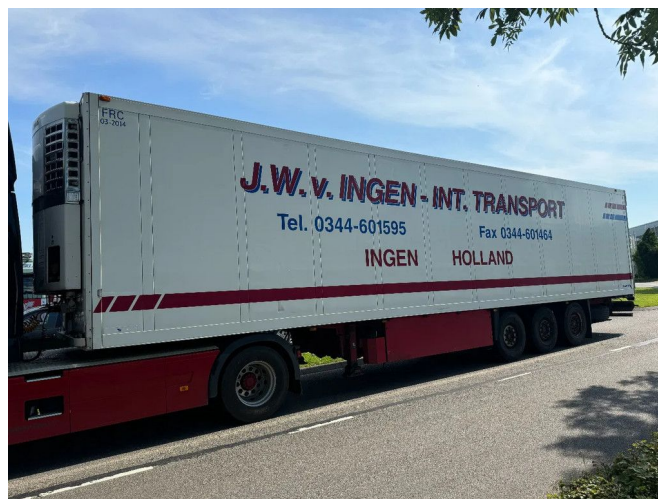
Schmitz Cargobull SKO 24 - 3 AXLE - SAF + THERMOKING ...