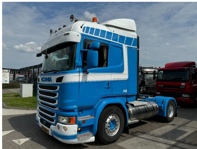
Scania G340 4X2 - LNG + EURO 6 + RETARDER