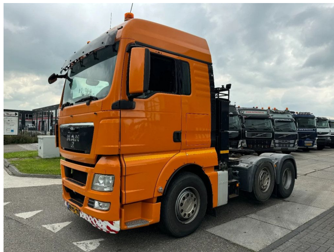
MAN TGX 26.440 6X2 - EURO 5 + MANUEL GEAR + STEER...