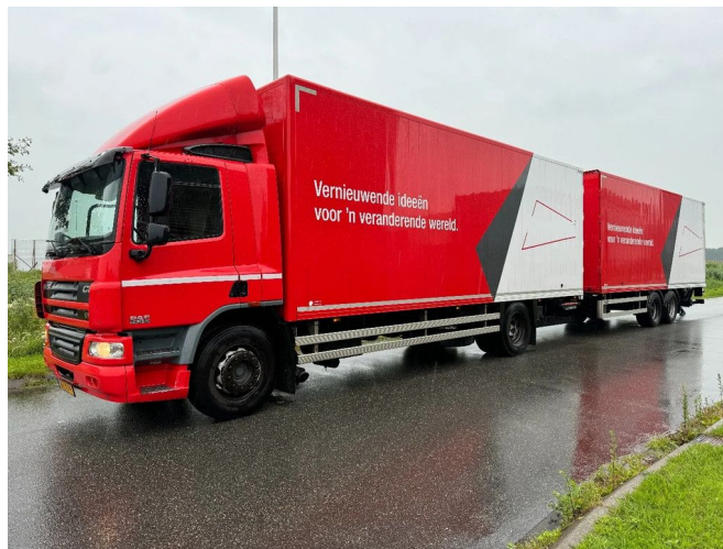
DAF CF 75.310 4X2 + LAG HANGER + TÜV TILL 01-2025