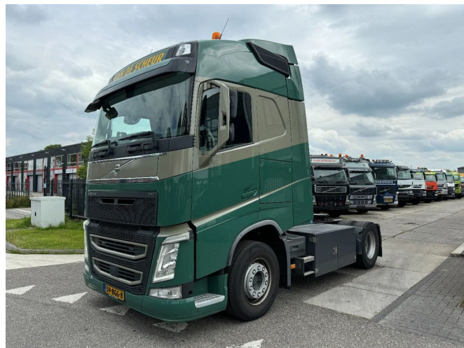
Volvo FH 420 4X2 EURO 6 ONLY 514.022 KM