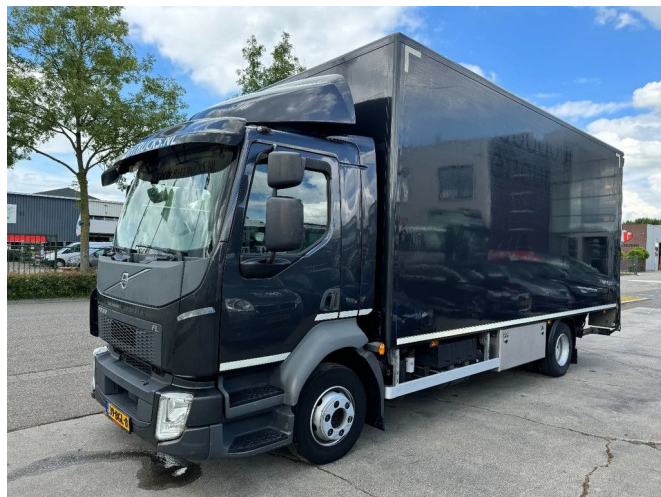
Volvo FL 210 4X2 EURO 6 BOX 6.05 METER