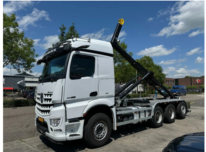
Mercedes-Benz Arocs 3258 8X4 NEW HOOKLIFT HYVA 26T