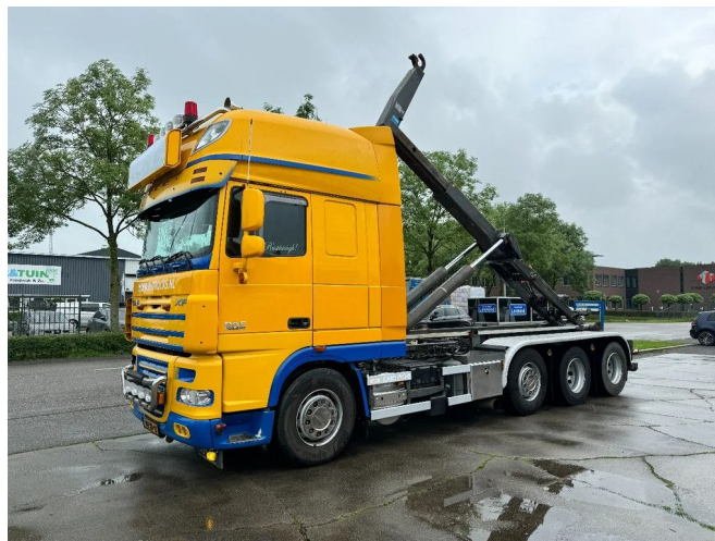
DAF XF 105.460 8X2 EURO 5 HOOKLIFT VDL 30-6500