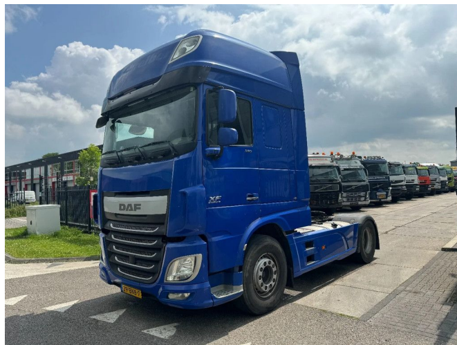
DAF XF 460 4X2 EURO 6 RETARDER SKIRTS