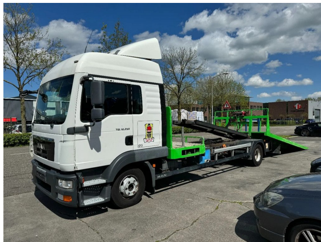
MAN TGL 12.250 4X2 EURO 5 + SCHUIFPLATEAU MET LIER...