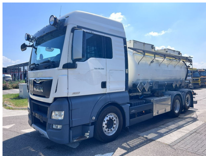
MAN TGX 26.560 6X2 EURO 6 - 11.500L VACUUM CLEANER...