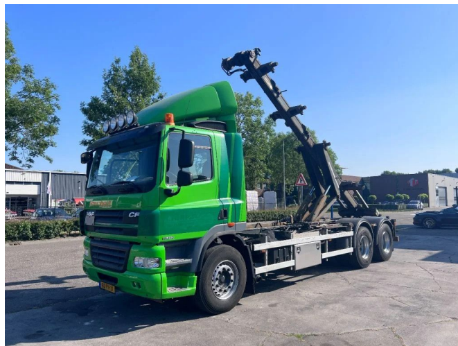
DAF CF 85.410 6X2 EURO 5 + TRANSLIFT CHAIN